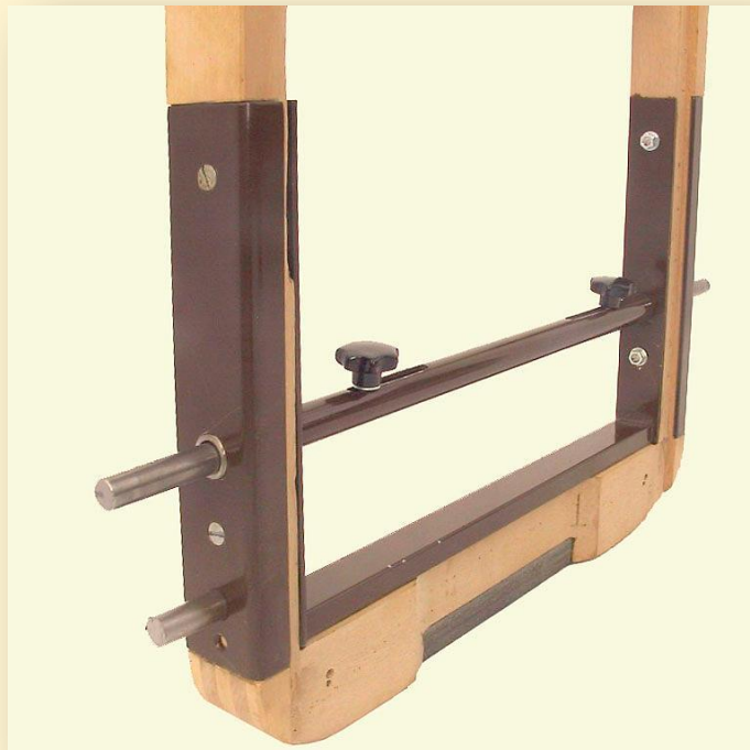
SITZ MIT PATENTRAHMEN