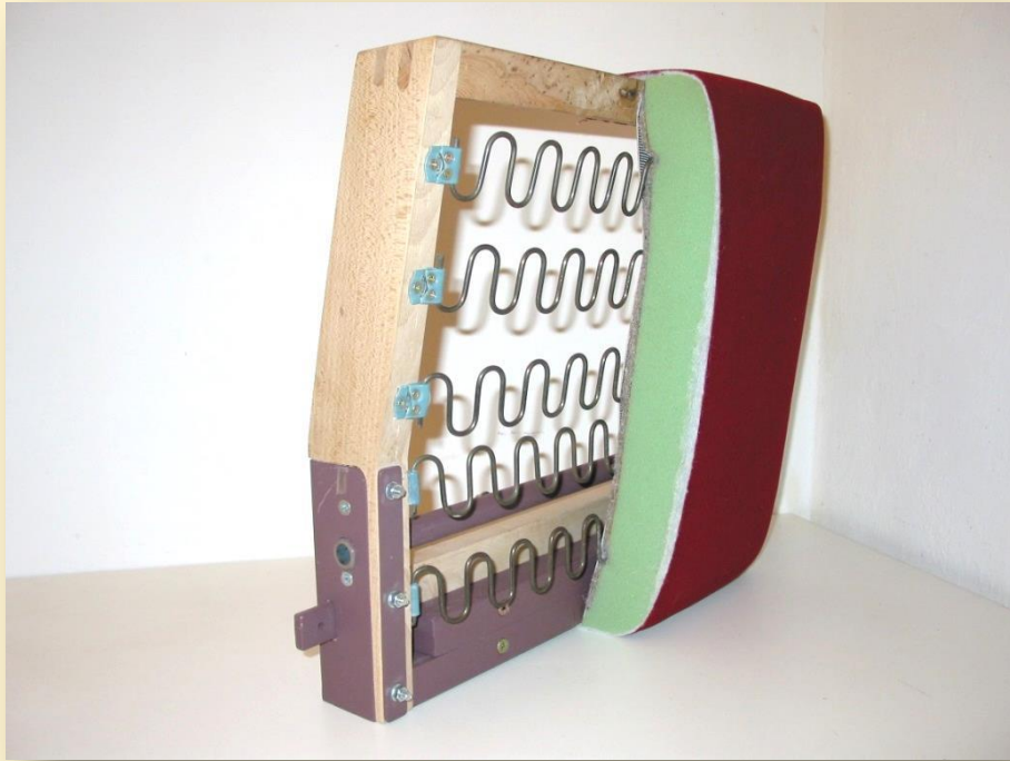
Sitz mit Patentrahmen - Kaltschaumpolster