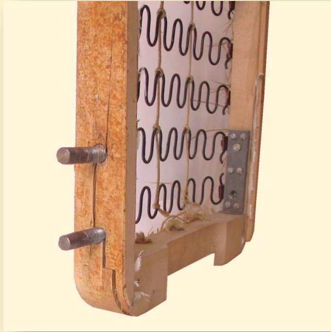
SITZ MIT RISS