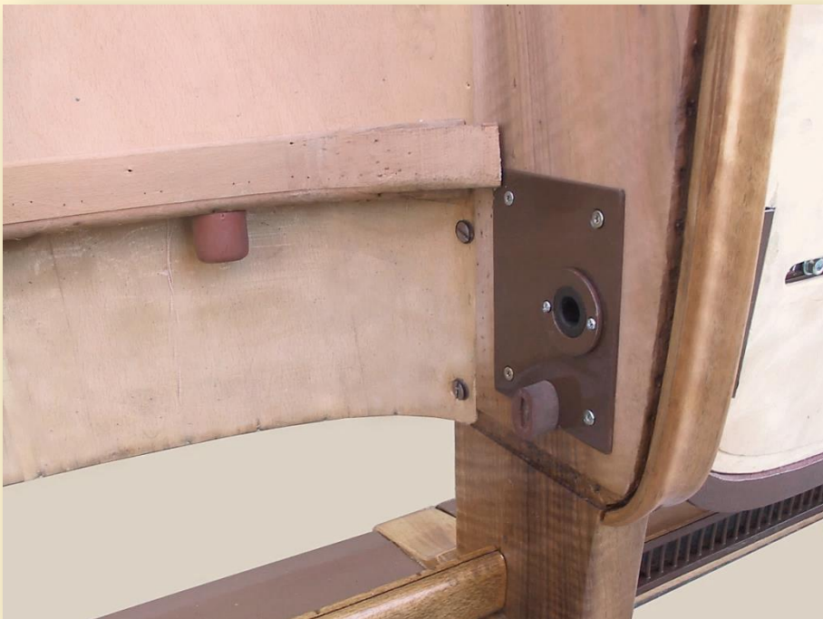
Seitenwange mit Achsenaufnahme (Polyamid Büchse)